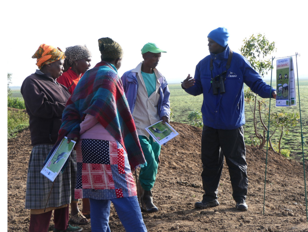
Zusammenarbeit mit den lokalen Gemeinden