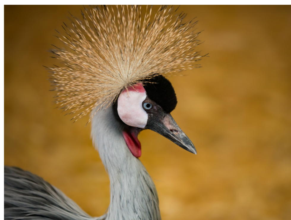
Grauer Kronenkranich ( Balearica regulorum )