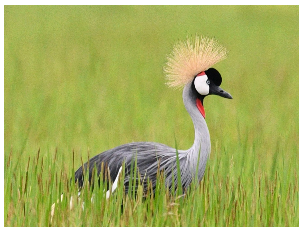
Grauer Kronenkranich ( Balearica regulorum )

Durch Ihre Spende werden zwei Geländemotorräder finanziert, sowie Ausrüstungsgegenstände, darunter Regenjacken, Gummistiefel, Ferngläser oder Rucksäcke. Außerdem soll eine Baumschule und ein Team aus freiwilligen Kranichschützerinnen aufgebaut werden.