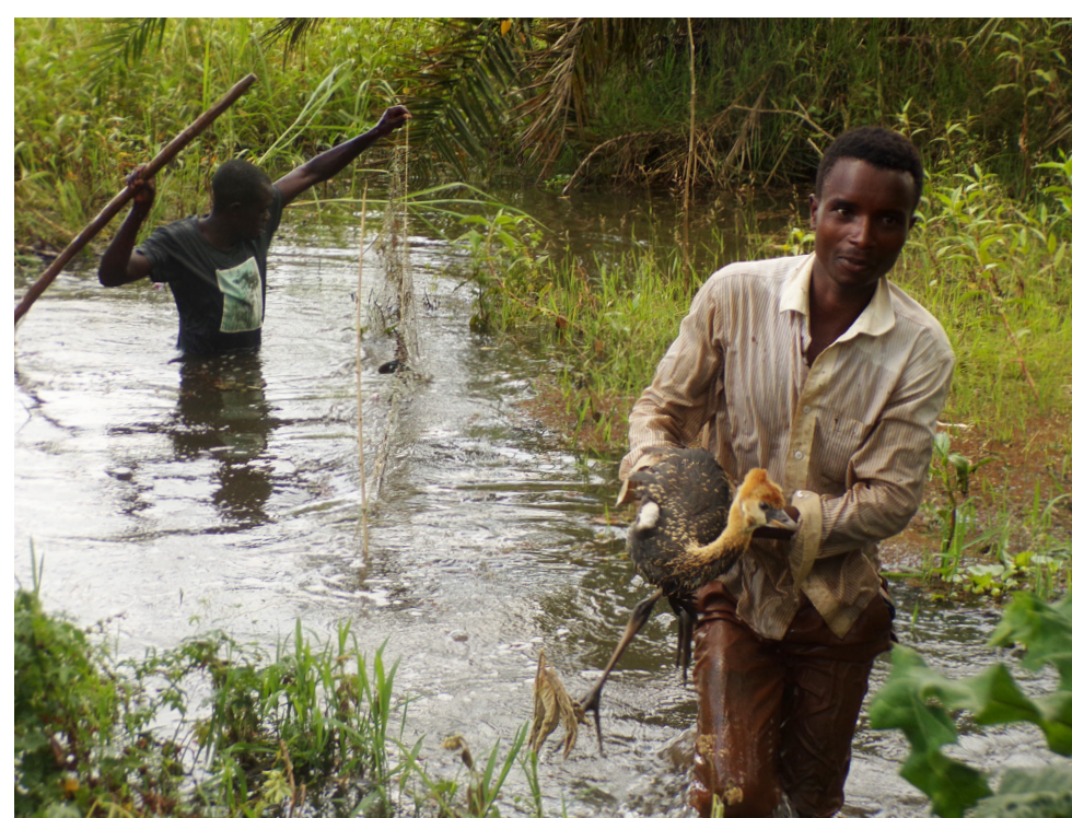
Befreiung eines jungen Kronenkranichs aus einer Falle