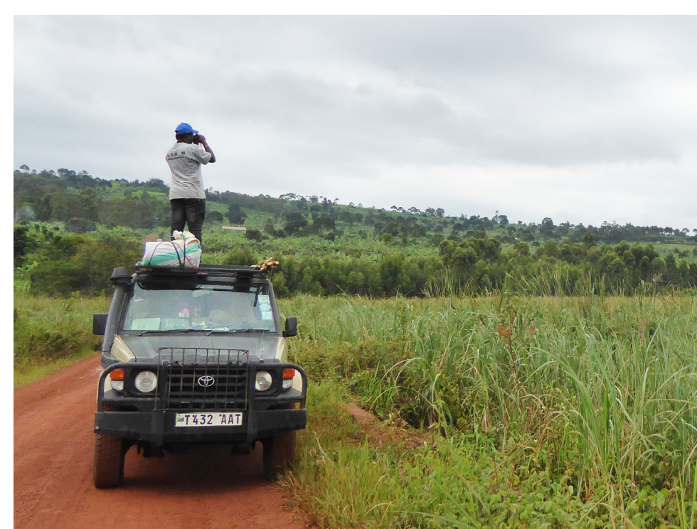
Projektarbeit in Tansania