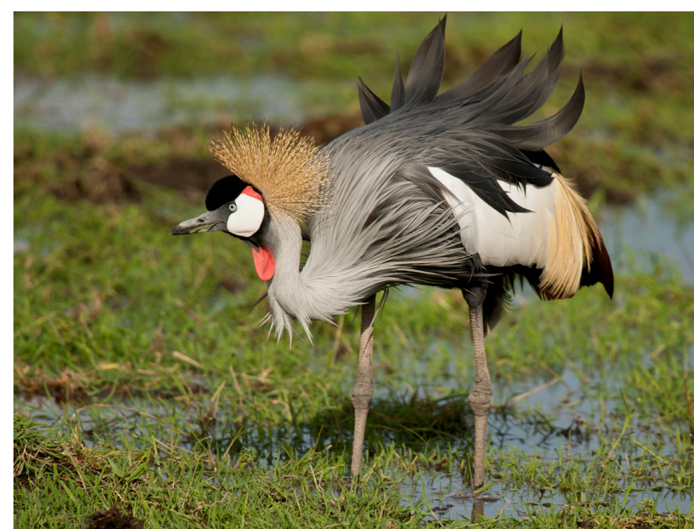
Grauer Kronenkranich im Feuchtgebiet