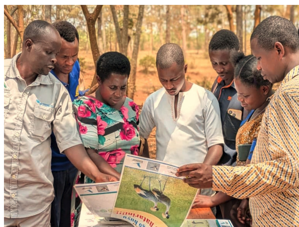
Öffentlichkeitsarbeit für den Kronenkranichschutz

Durch Ihre Spende wird ein Geländefahrzeug finanziert, das dem Projektteam den Zugang zu den schwer erreichbaren und weitläufigen Gebieten ermöglicht. Zunächst sollen 20 Kranichschützer ausgebildet und ausgestattet werden. Kamerafallen und GPS-Geräte werden finanziert und Öffentlichkeitsarbeit für eine naturverträglichere Landwirtschaft umgesetzt.