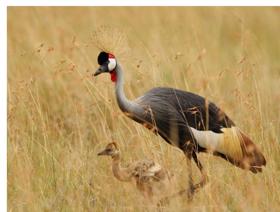
Grauer Kronenkranich mit Jungtier